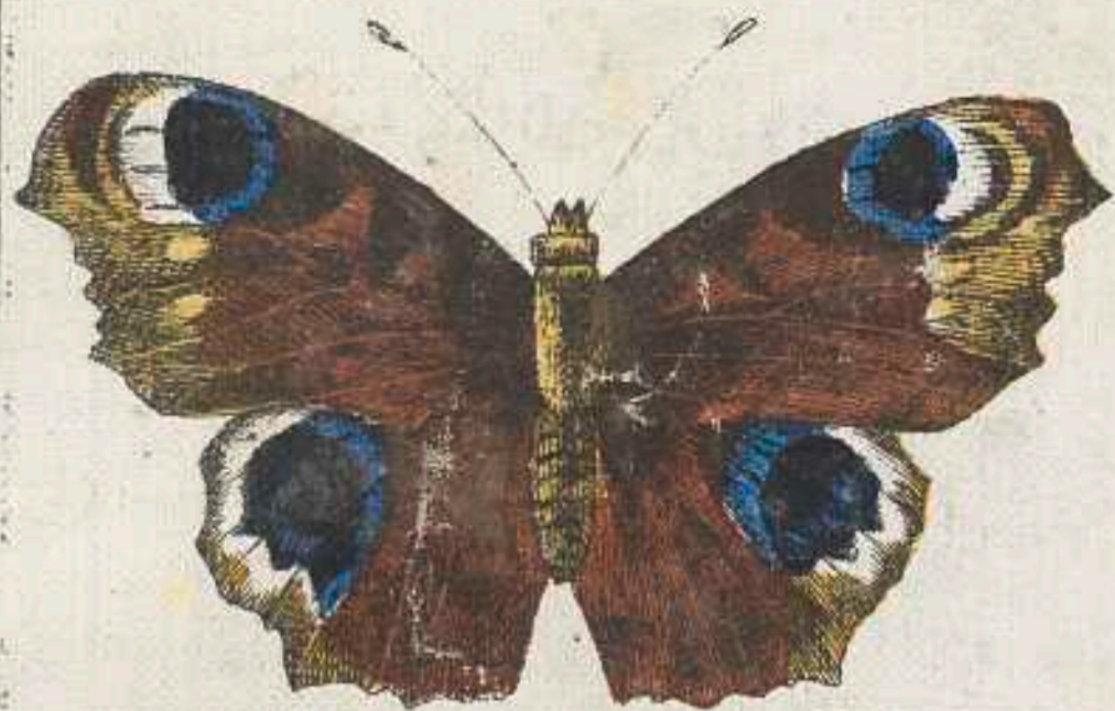
Von Blume zu Blume Schmetterling fliegt,