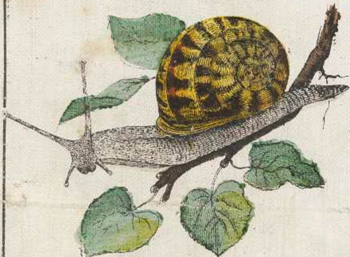
Schnecke kriecht langsam auf grüner Au',