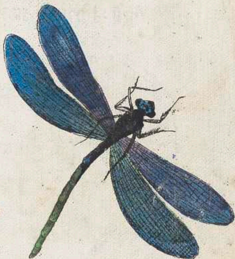
An Bächleins Ufer Cikade sich wiegt.