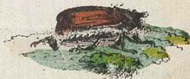
Maikäfer berauscht sich in Blüthenau,