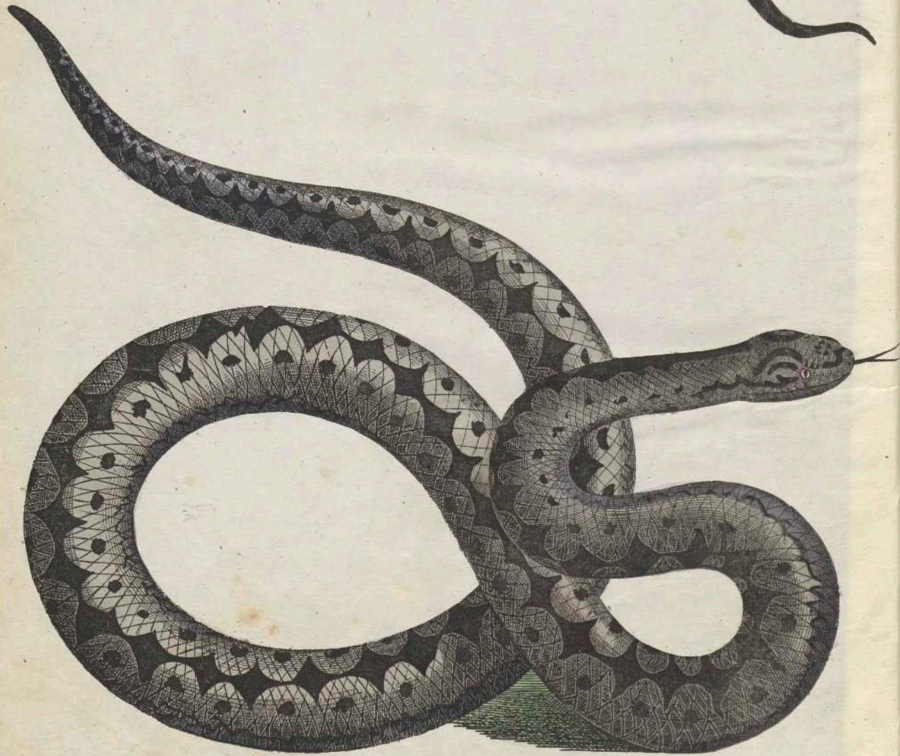
b. natürliche Größe