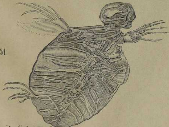
Fossile Schuttkröte aus dem Schiefer von Glarus.