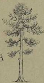
Längsdurchschnitt v. Araucaria Coning. / Ein Araucaria als Baum. ( hemi. )