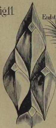
Einige Blattansätze in natürlicher Grösse.