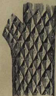
Stück eines Stammes von Lepidodendron elegans .