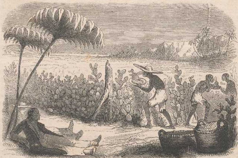
Der Cochenille-Cactus oder Noval (Cactus opuntia).