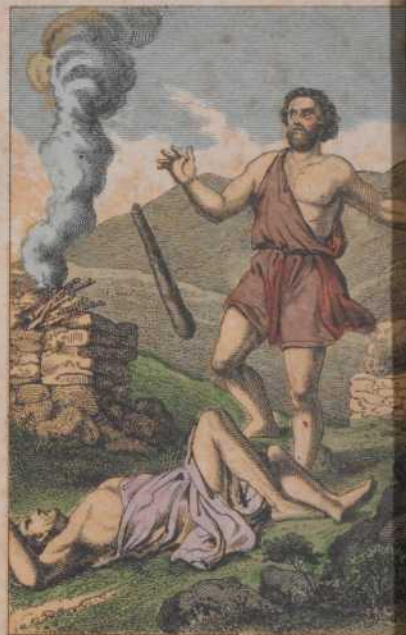
Evang. Gesellsch. in Stuttgart.

Da redete Cain mit seinem Bruder Abel. Und sich, da sie auf dem Felde waren, erhob sich Cain Bruder Abel und schlug ihn todt. 1 Mos. 4, 8.