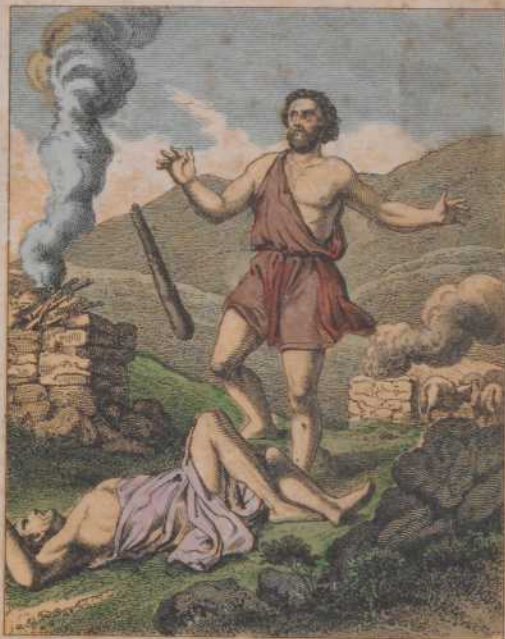
Evang. Gesellsch. in Stuttgart.

Da rebete Cain mit seinem Bruder Abel. Und es begab sich, da sie auf dem Felde waren, erhob sich Cain wider seinen Bruder Abel und schlug ihn todt. 1 Mos. 4, 8.